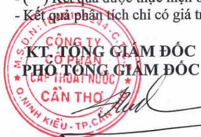
Huỳnh Thiện Đình

Ghi chú: - (*) Các phương pháp được công nhận ISO 17025:2017; - (**) Kết quả được thực hiện bởi nhà thầu phụ; - Kết quả phân tích chỉ có giá trị trên mẫu thử.